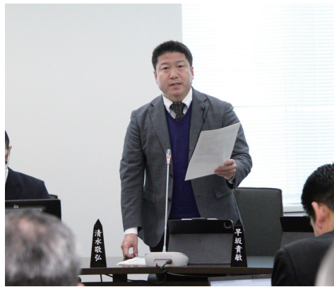
▲意欲と希望が持てる生産現場の「担い手対策」 などの質疑 (農政委員会)