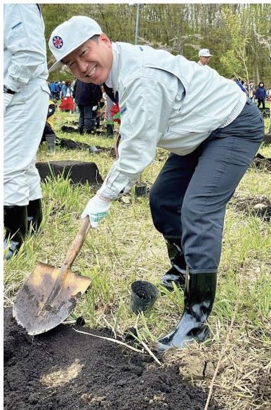
第75回北海道植樹祭にて▶ (函館市)

本年も、皆さまの変わらぬご指導・ご鞭撻のほど、どうぞよろしくお願い申し上げます。