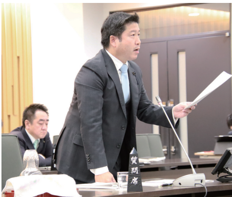
▲野生鳥獣対策(ヒグマ)における集中質疑 (予算特別委員会)