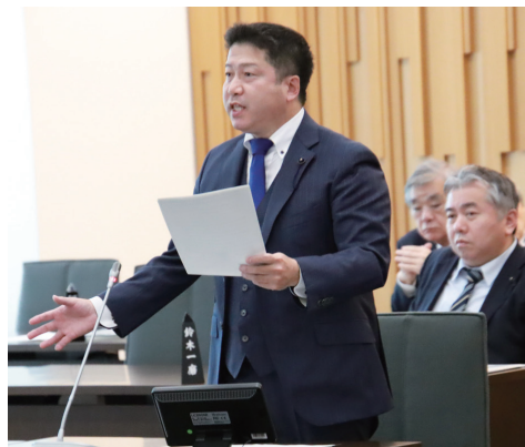
▲泊原発の「安全対策」における集中質疑② (予算特別委員会)