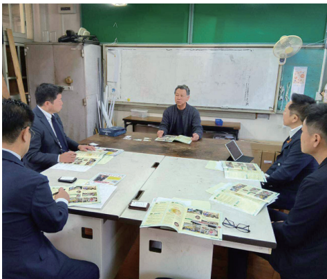
▲北九州子どもの村小中学校「校長先生との意見交換」 (福岡県北九州市)