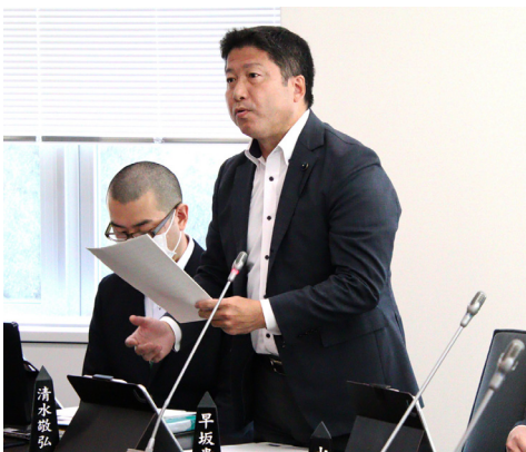
▲種馬鈴しよの「安定生産」と新たな「産地形成」などの 質疑 (農政委員会)