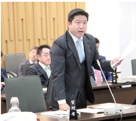
▲野生鳥獣対策(エゾシカ・アライグマ)における 集中質疑 (予算特別委員会)