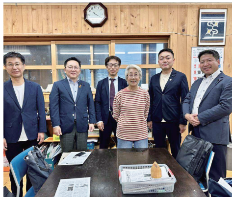
▲珊瑚舎スコーレ「現地視察」(沖縄県南城市)