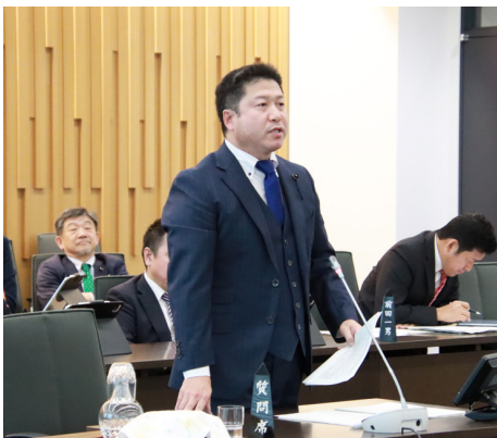
▲泊原発の「安全対策」における集中質疑① (予算特別委員会)