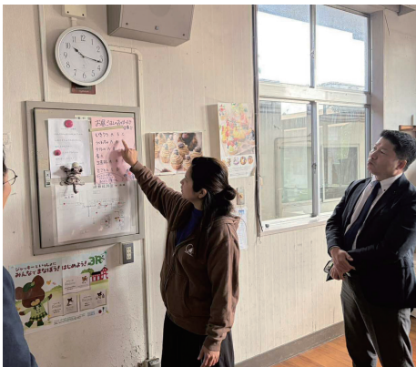
▲北九州子どもの村小中学校「現地視察」 (福岡県北九州市)